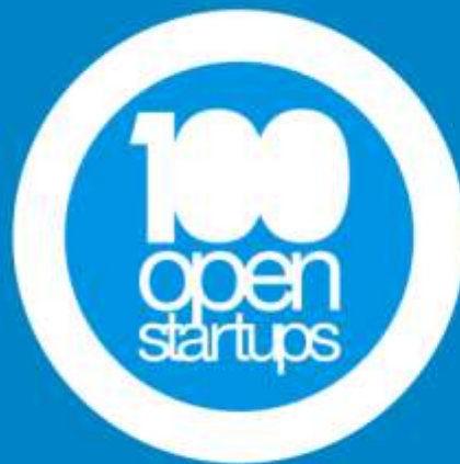
Prêmio 100 Open Startup (2023)