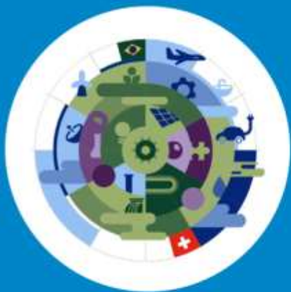
Prêmio Suíço de Inovação e Tecnologia (2023)