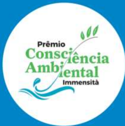
Prêmio Consciência Ambiental (2023)