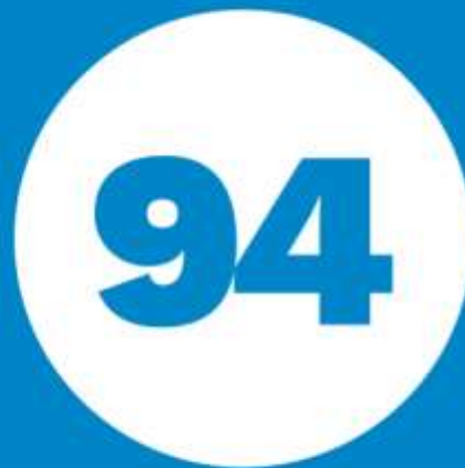
Resultado NPS (2023)